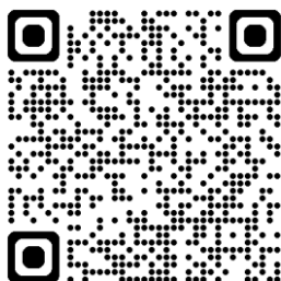
Weitere Informationen Huayu-Stipendium